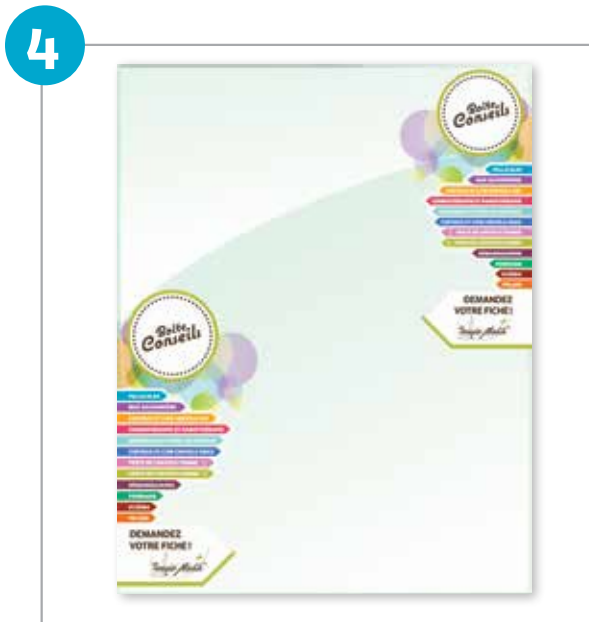
(2) électrostatiques pour miroir