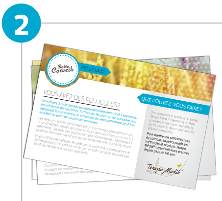
(5) lots de 12 fiches + (12) séparateurs