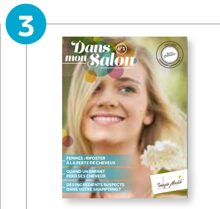
(5) magazines « Dans mon salon »