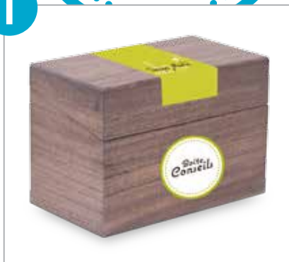
(1) boîte conseils en bois