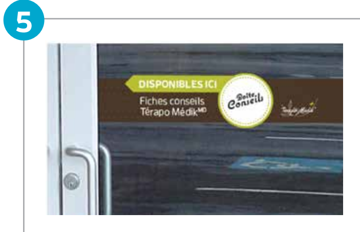
(1) électrostatique pour porte